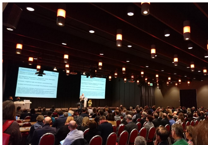
Alterstraumatologie Kongress 2018 in Zürich